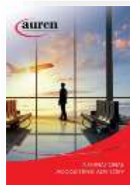
International Accounting Advisory