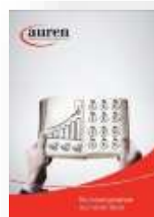
Rechnungswesen auf einen Blick