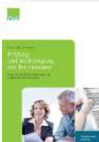
Prüfung und Berichtigung von Rechnungen