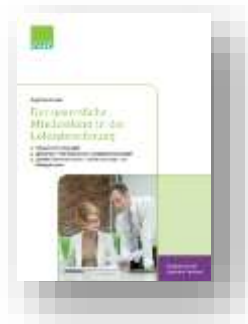
Der gesetzliche Mindestlohn in der Lohnabrechnung