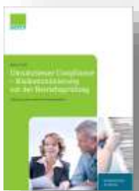
Umsatzsteuer Compliance – Risikominimierung vor der Betriebsprüfung