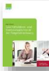
Geschäftsführer- und Vorstandsgehälter in der Entgeltabrechnung