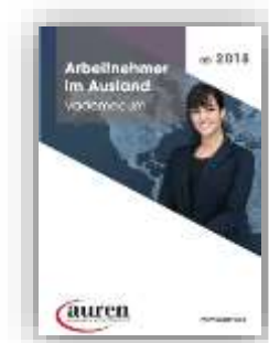
Arbeitnehmer im Ausland