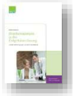
Bescheinigungen in der Entgeltabrechnung