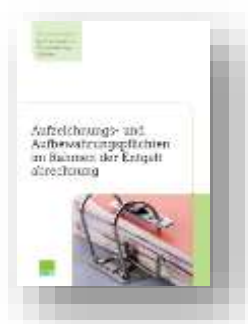
Aufzeichnungs- und Aufbewahrungspflichten im Rahmen der Entgeltabrechnung