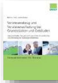
Vorsteuerabzug und Vorsteueraufteilung bei Grundstücken und Gebäuden