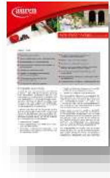
Non Profit Aktuell