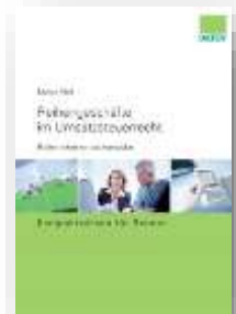
Reihengeschäfte im Umsatzsteuerrecht