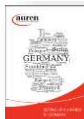
Setting up a Business in Germany