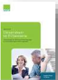
Umsatzsteuer im e-Commerce