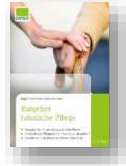
Ratgeber häusliche Pflege