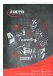
Rechnungswesen – Komplettlösungen aus einer Hand