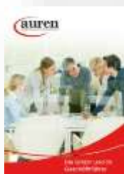
Die GmbH und ihr Geschäftsführer