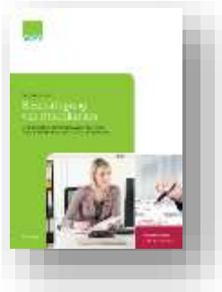
Beschäftigung von Praktikanten