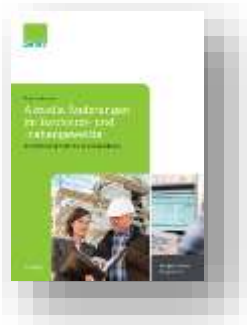
Aktuelle Änderungen im Bauhaupt- und -nebengewerbe