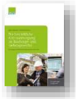
Die betriebliche Altersversorgung im Bauhaupt- und -nebengewerbe