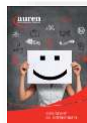
Gesundheit im Unternehmen