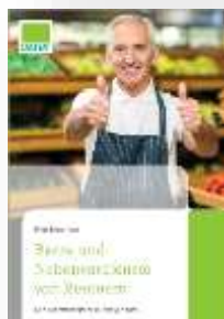
Rente und Nebenverdienste von Rentnern