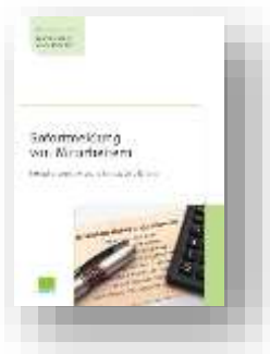
Sofortmeldungen von Mitarbeitern