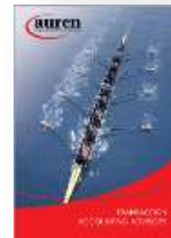
Transaction Accounting Advisory