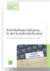
Mehrfach- beschäftigung in der Sozialversicherung