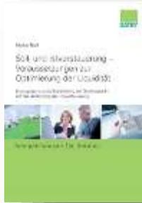
Soll- und Istversteuerung – Voraussetzung zur Optimierung der Liquidität